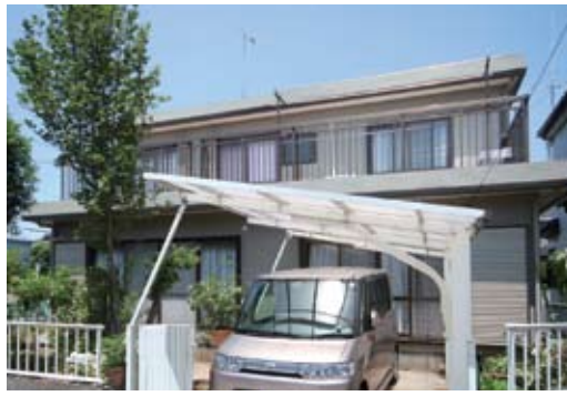
U様が売却しK様が購入された築22年のNEWパルフェ

っていたのですが、実際の査定では想像よりも高い評価が提示され、驚かれたのだとか。「土地はずいぶん評価が下がりましたが、いい家の価値は保たれるんですね」と、セキスイハイムの高い評価に大満足されている様子。