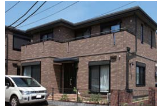
M様が購入された築8年の進パルフェ

という経緯。「安心して暮らすには家の構造がしっかりしていることが重要ですが、ハイムなら安心。それにスムストックは土地と建物の価格が分かれて表示されていて、価値が分かりやすいんです。ひとつの安心材料になっていますよ」